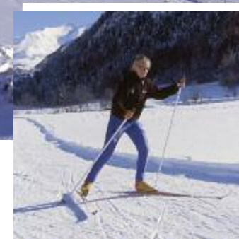
La station familiale !